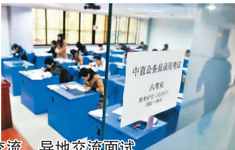
考官全员交流 异地交流面试