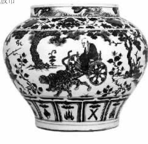
元青花鬼谷子下山图罐