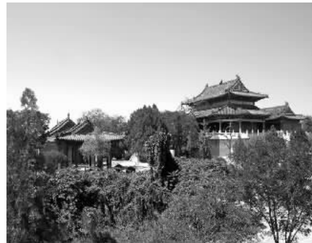
何家庄村的古庙景象

惯。上千年的岁月给了何家庄人独有的坚持。在这里，人们仍喜居宽巷阔堂矮楼房，白日敞门而不锁，夏日借古槐而乘凉。村中古老肃穆的建筑以及村民古朴洒脱的秉性恰如诗中所言：“八卦台上坐伏羲，经纬天地演玄机。太行山麓花艳艳，金水河畔柳依依。河图漫说结网事，洛书弹奏驾辩曲。人文始祖开基业，民族生生永不息。”