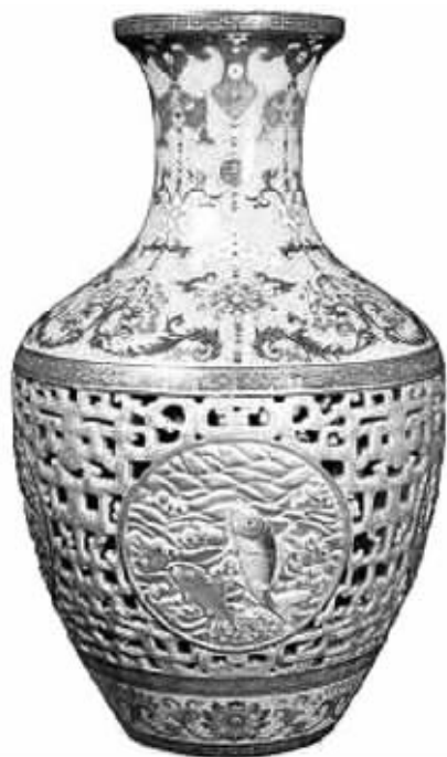
清乾隆粉彩镂空瓷瓶

8月30日，第十二届全国人大常委会第四次会议作出决定，授权国务院在中国（上海）自由贸易试验区内，对国家规定实施准入特别管理措施之外的外商投资，暂时调整外资企业法、中外合资经营企业和中外合作经营企业法规定的有关行政审批。颇有戏剧性的是，之前“决定草案”中引发强烈关注的内容——“在上海自贸区内，允许符合条件的外商独资或中外合资、中外合作企业在试验区内从事文物拍卖业务”，没有出现在决定中。这就意味着，外资拍卖行借助上海自贸区进驻中国内地拍卖市场的愿望落空了，内地拍卖企业依旧“安全”。