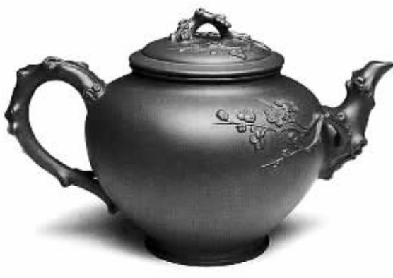
顾景舟大梅花壶（紫砂）