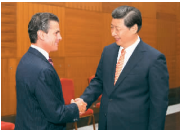
习近平会见培尼亚。