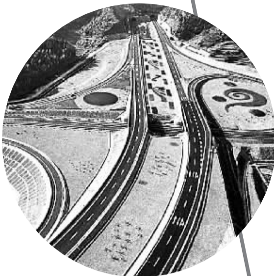
福建构建高速公路网络,加强深化山海(山区)海(沿海)协作,促进经济发展。

去年4月,晋江市一次性向长汀县落实帮扶资金800万元;8月,长汀县9名干部分别被派到晋江市(街道)、经济开发区、行政审批中心等单位任职;11月,晋江市组织对口帮扶的相关镇村到长汀县开展回访