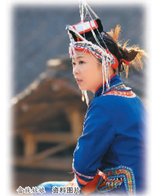
畲族姑娘 资料图片