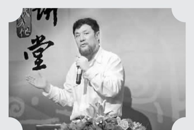
中国东方歌舞团艺术总监、副团长陈维亚作客深圳市民文化大讲堂