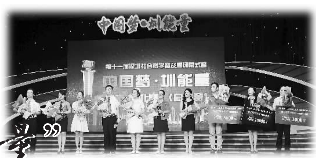
深圳第十一届社会科学普及周启动仪式