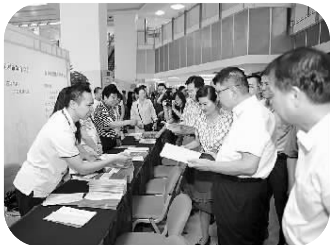
社会科学普及周的展位人气很旺

而历届社科知识竞赛更是清晰呈现了社科普及周的时代特色，如2009年题为“复兴之路与创新之城”，2010年题为“新起点·新发展——纪念深圳经济特区成立30周年”，今年则题为“中国梦·圳能量”。