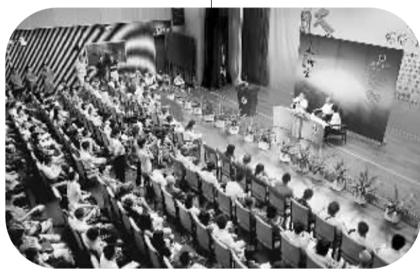
市民文化大讲堂座无虚席。

在刚刚过去的8月，广大市民“修完”了教育·励志系列专题“课程”，现在他们又开始了9月份法律·经济系列的“学习”。