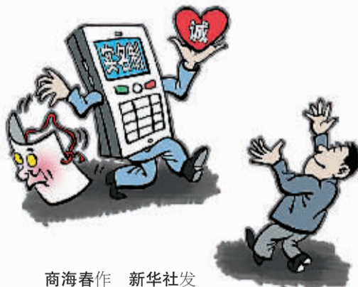
南海春作 新华社发

当然,电话实名制在推行过程中,其效果并非一蹴而就。未实名的老用户如何登记,电信运营商如何