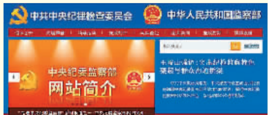
中央纪委监察部网站是由中共中央纪律检查委员会、中华人民共和国监察部主办的综合性政务门户网站,设有导航栏、头条要闻、专题专

要学网懂网用网,注重发挥专家学者作用,向群众答疑解惑,回应社会关切。王岐山指出,网站是前台,支撑在后台,纪检监察系统特别是委部机关都要参与和支持网站建设,形成合力。办好网站关键在人,要建设高素质的人才队伍,敢于探索创新,不断提高办网水平。