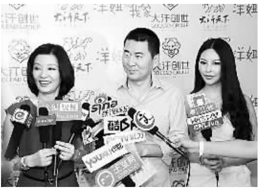
开机仪式上，演员接受媒体采访。从左至右：徐帆、陈建斌、方飞

以看出，纪录片已成为中国电视产品进入海外主流媒体的“主力军”，成为对外传播中国文化的最有效方式。