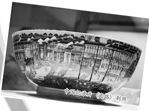
中国纪录片《瓷路》剧照

今年，中央电视台纪录频道参加戛纳电视节，有9部原创纪录片参展，包括以浓郁中国元素为特点的《京剧》、《园林》、《舌尖上的中国2》，以中国对外商业文化交流为主题的《茶——一片改变世界的叶子》、《瓷路》，以中外文化互动为主题的《发现肯尼亚》、《对照记》等，受到了参会各国机构和国际买家的高度关注和青睐，片花点击率在亚洲纪录片中名列前茅。“它们形成了集群化的规模效应，我们也被海