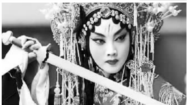
中国纪录片《京剧》剧照