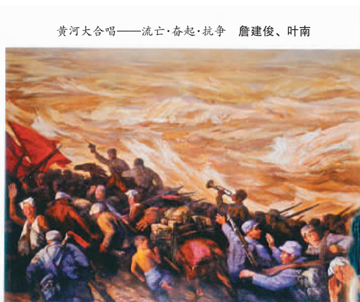
黄河大合唱——流亡·奋起·抗争 詹建俊、叶南