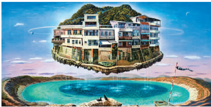
石碇之乡慈停泊 (油画)