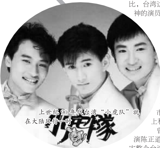
上世纪90年代台湾“小虎队”就在大陆风荷一时

吴奇隆和苏有朋都是上世纪90年代红遍大江南北的“小虎队”成员，在大陆拍戏有先天优势。林心如则是和苏有朋一起，1997年到大陆拍《还珠格格》，