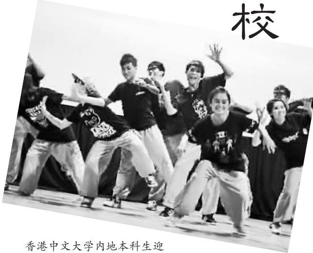
香港中文大学内地本科生迎新晚会开场舞蹈。