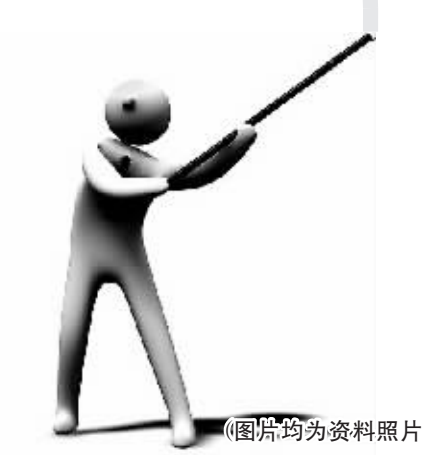
(图片均为资料照片)

结开了服装店，张信哲开了一家名为“上海三千院”的饭店，演员孙兴的“非常越餐馆”生意也很红火。周杰伦在成都开了“亚洲舞蹈馆”，在西安开了KTV；吴宗宪则在昆山开了LED厂，虽然一度经营不善，但2012年公司获利据称已经超过了他的演艺收入。