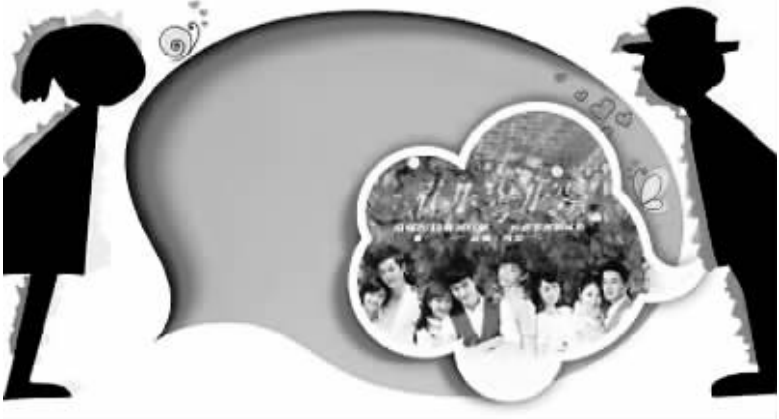
琼瑶剧至今在大陆拥有众多粉丝

联谊会上，全国政协副主席罗富和向有关机构的代表颁发了“中国爱心敬老公益事业大奖”的奖牌和奖杯。中国书法家协会副主席苏士澍等书画家向与会的长者捐献书画作品，艺术家们表演了精彩的文艺节目。