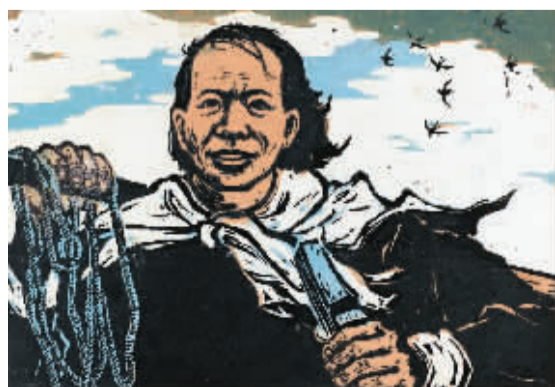
生产队长(油印套色木刻) 罗映球

有勾勒农忙收获的喜悦画面，也有呈现同仇敌忾的战斗场景，在罗映球先生的铁笔下，过往的历史生动而丰富。适逢罗映球诞辰100周年，由中国美术馆、中国美术家协会、中共广东省委宣传部、中共梅州市委、梅州市政府共同主办的“铁笔如椽——罗映球版画艺术展”日前在中国美术馆举行。200余件木刻佳作浓缩了艺术家70年刀版岁月。