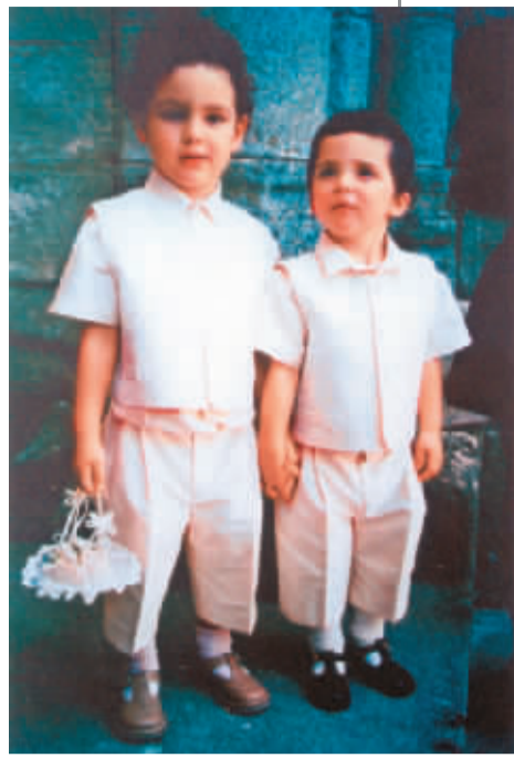
《伴童》2002年6月摄于葡萄牙艾武拉市 邵华泽