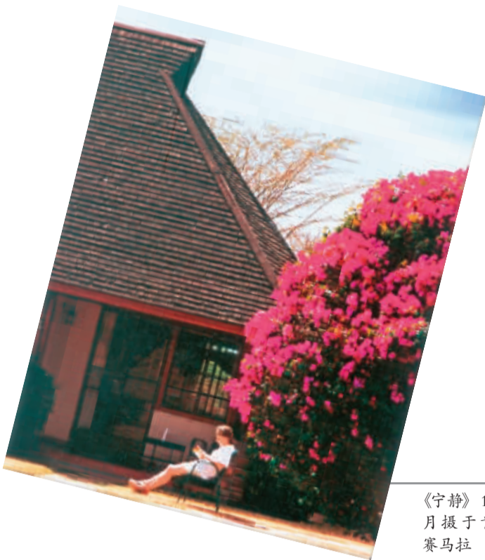
《宁静》1999年11月摄于肯尼亚马赛马拉 邵华泽