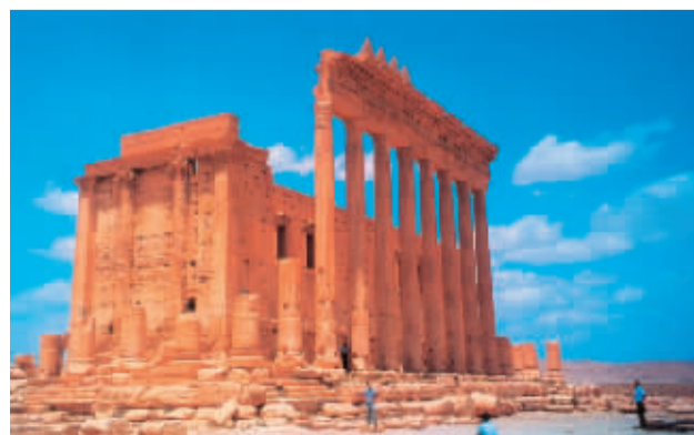
《台德木尔的古建筑》(建于公元1世纪，挺拔的神庙、气派的凯旋门、两侧高耸的立柱、精工细作的雕刻、美轮美奂的壁画……加上金色阳光的渲染，眼前的台德木尔呈现出一派海市蜃楼般的奇景。) 2000年5月摄于叙利亚台德木尔 邵华泽

罗映球(1914—2006年)，广东兴宁人，著名版画家。上世纪30年代受同乡罗清桢、张慧等人影响开始了版画事业。抗战爆发后，更以版画作为宣传利器，刀版中凝聚了跌宕起伏的战争岁月，是广东地区新兴木刻运动的重要参与和见证。