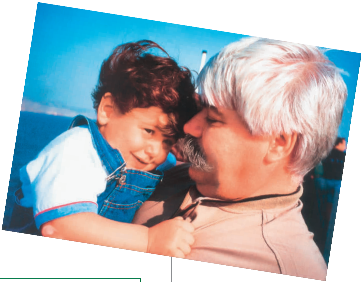
《相拥》2000年5月摄于希腊雅典 邵华泽

摄影对于长期从事新闻工作的邵华泽来说，不仅仅是一种爱好，更是一种责任。作为一名老报人，他是中国改革开放和新闻文化事业发展的重要见证人和参与者。上世纪80年代末，对新闻摄影重视不够。1990年8月20日，中华全国新闻工作者协会和中国新闻摄影学会在银川召开首届全国报纸总编辑新闻摄影研讨会，时任人民日报总编辑的邵华泽在会上作了“两个提高，一个关键”的重要发言，对于90年代报纸“图文并重”的进程起到了很大的推动作用。正是基于这样的认识，作为总编辑的邵华泽亲力亲为，除了在报社采取多种措施加强新闻摄影工作之外，自己也拿起了照相机，不懈地学习探索，至今已坚持了20余年。有专家称道他的摄影作品是“理性的诗、感性的画、立体的艺术”。