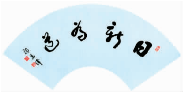
日新为道(扇面) 邵华泽书