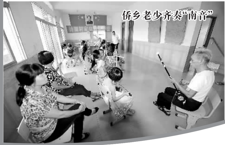
侨乡老少齐奏“南音”

8月21日，福建侨乡泉州南安诗南村的老人小孩在村文化园里齐奏有“中国音乐史上活化石”之称的南音。南音典雅优美，独具魅力，千年来广泛流传于泉州一带闽南语系地区，并远播台湾、港澳和东南亚等地，成为联系世界各地闽南人的精神纽带。