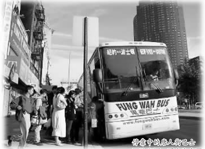
停靠中的唐人街巴士