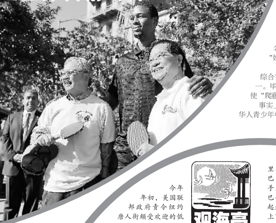
旧金山华裔举行乒乓球节

8月21日，福建侨乡泉州南安诗南村的老人小孩在村文化园里齐奏有“中国音乐史上活化石”之称的南音。南音典雅优美，独具魅力，千年来广泛流传于泉州一带闽南语系地区，并远播台湾、港澳和东南亚等地，成为联系世界各地闽南人的精神纽带。