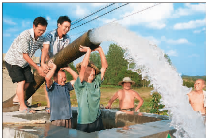
近日,连续干旱旱高致湖北省崇阳县受灾严重,干旱指数史上首次达特旱等级。截至目前已造成5万亩水稻、10万亩玉米等旱地作物绝收,19万亩经济林受灾,3万多人、5000多头牲畜饮水困难,初步统计损失达3亿元。