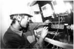
8月8日早上7时,在宁波镇海区路驼街进贤街耕渔路,镇海客户分中心、运检站员工正在为宁波市镇海博浪金属制品厂进行高压扩容工作。

近日,衢州供电公司对消防设备进行“体检”,确保消防设备“健康”运行。该公司安监部组织消防检测单位、维保单位负责人和技术人员编写《消防设备检测安全、技术专项措施施工方案》,组织人员培训和施工安全交底,经考试合格后进驻工作。(章红峰 吴龙锋)