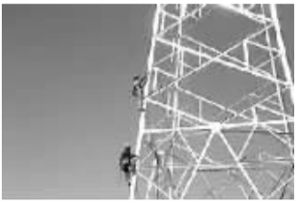
8月13日,在江山市大陈乡110千伏仙常线路高压线改造施工现场,国网衢州供电公司工人顶着40度高温在铁塔上验收检查。周小军 摄

8月12日凌晨4时,经过两天两夜奋战,宁波供电公司检修试验工区完成220千伏蔡郎变17个35千伏开关柜整改工作。8月10日,40名工作人员进驻施工现场,12日凌晨4时,最后一个开关间隔送电检修完成。(谢素敏)