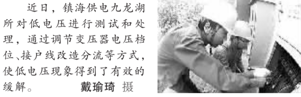
近日,镇海供电九龙湖所对低电压进行测试和处理,通过调节变压器电压档位、接户线改造分流等方式,使低电压现象得到了有效的缓解。

近日,岱山农排线路升级改造进入架线阶段。今年岱山县供电公司投入资金1465万元,新建或改造10千伏农网线路12.5公里。该公司利用晴日加紧改造农排线路,争取在年内完成该项惠民工程。此外该公司提前完成37个社区农村农网线路改造意见框架协议签订工作,为改造工程顺利进行打下基础。(胡飞)