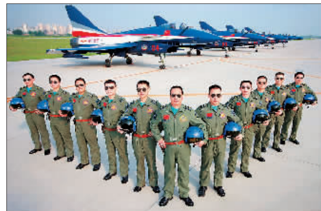
8月18日，空军八一飞行表演队启程赴俄罗斯参加第十一届莫斯科航展。这是“中国蓝天仪仗队”组建51年来首次飞出国门走向国际飞行表演大舞台。图为赴俄参展的全体飞行员。