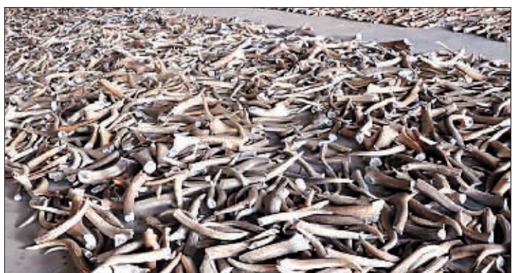
呼和浩特海关日前在中蒙二连公路口岸查获一起重大走私珍贵动物制品入境案，走私团伙利用货车车厢改造夹层，藏匿走私国家二级保护动物马鹿角1.5吨，共计713根。一名蒙古国籍犯罪嫌疑人被当场抓获。目前，案件正在进一步侦办中。图为查获的大量马鹿角。