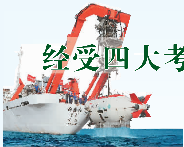
▲ 母船“向阳红09”起吊“蛟龙”号。