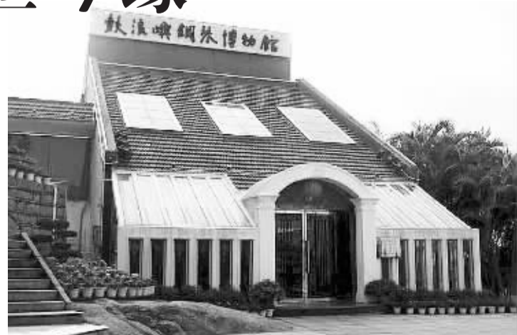
鼓浪屿钢琴博物馆