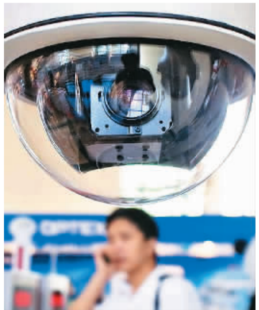
无处不在的摄像头。

“徒法不足以自行”，应该通过法律建设，提高社会民众和广大执法人员的法治观念，使隐私权利被接受为公众意识和社会常识，这样才能减少对安装摄像头所引发的问题的争议。