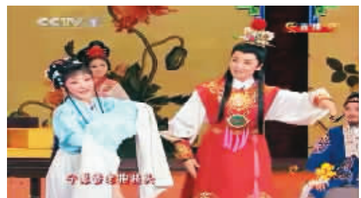
央视春晚晚上，韩再芬版苏宝玉惊艳全场

在变革的同时，韩再芬和其他黄梅戏艺术家们也意识到，创新并非摒弃传统。黄梅戏之所以能够流传得这样广泛，唱腔旋律好听是主要原因。因此，唱腔是最能显示黄梅戏本质特征的部位，也是创新过程中最须继承的部位。传承与发展并不矛盾，在运用现代艺术手段创作新剧、投射艺术家对当代社会理解的同时，传承黄梅戏的经典唱腔，这样，黄梅戏才能更好地向前走。