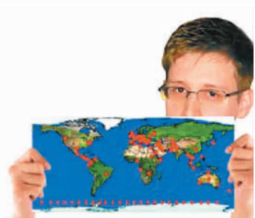
7月31日，斯诺登曝光“Xkeyscore”计划细节。沈思明制图