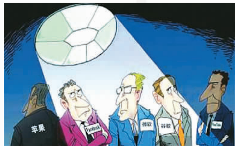
美国参与“棱镜”计划的IT企业被曝光

所谓道义高地，所谓“不作恶”，都是童话里的故事。在美国“绝对安全”的国家利益面前，其他国家的利益，包括本国民众的隐私和自由，都是可以牺牲的。