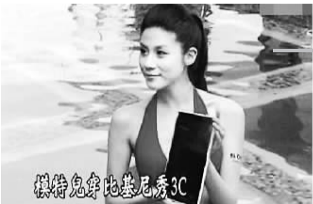
东森新闻采访的“水模”。

本报电 据台媒报道，手机和平板电脑吹“防水风”，也带动“水中模特儿”这一行的商机。模特儿的伸展台从陆地上带到游泳池中，“水模”不只要会游泳，还要在水中睁开眼睛，甚至在大水箱中不断变换姿势。