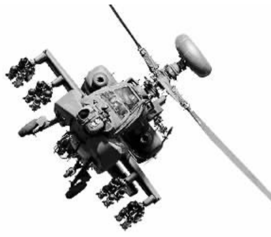
长弓阿帕奇攻击直升机

虽然美国极力进行“亚太再平衡”，但中国人民大学国际关系学院教授时殷弘对中美关系和台海的未来持乐观态度，他分析指出：“因为中国的崛起以及美国对中国的重视，台湾当局对中美关系的影响力比过去弱。”时殷弘表示，中国一方面要力图影响美国政策；另一方面争取影响台湾舆论。他表示，美国方面不会放弃台湾这张牌，或许对台售武器还将风波不断，但是真正启用会比较谨慎，因为他们是以“不惹急大陆为底线”。