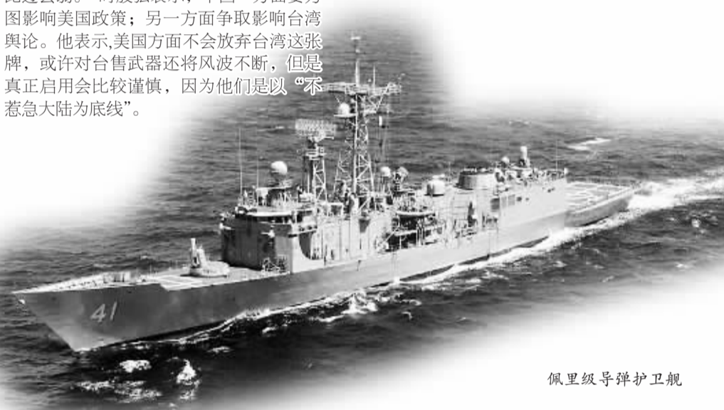
佩里级导弹护卫舰