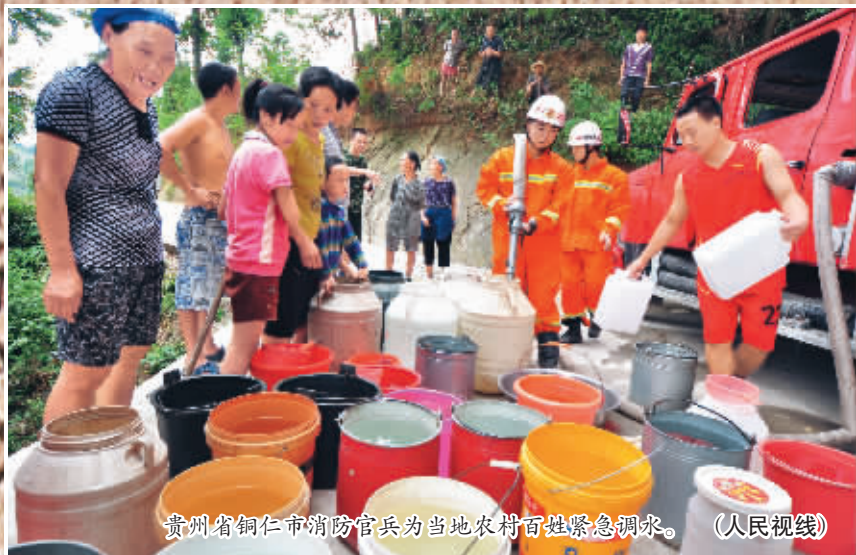
贵州省铜仁市消防官兵为当地农村百姓紧急调水。

本报北京8月5日电 综合本报和新华社消息,据民政部统计,6月中旬以来,我国南部贵州、湖南、湖北、重庆等13省市区遭受旱灾,已造成594.8万人饮水困难,403.4万人需生活救助。据国家防总办公室统计,截至8月5日,全国有5998万亩耕地受旱,其中作物受旱面积5474万亩,缺水缺墒面积524万亩。国务院办公厅日前发出通知,要求做好当前高温干旱防御应对工作。