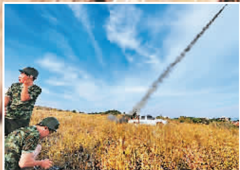
湖南省衡阳市祁东县遭遇罕见的旱情。图为祁东县气象局工作人员在发射增雨火箭弹。

8月5日,“2013年海外华裔及港澳台地区青少年‘中国寻根之旅’夏令营”的营员们参观游览了北京居庸关长城和国家大剧院。“寻根之旅夏令营”于8月3日在北京开营。来自世界55个国家和港澳台地区的4000名青少年欢聚北京,参加寻根之旅。图为营员们在居庸关长城上合影。