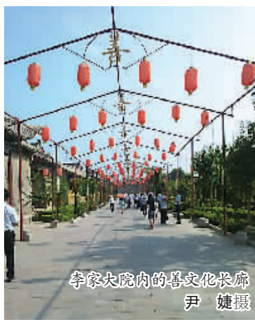
李家大院内的善文化长廊 尹婕摄

中国民居建筑有“北在山西，南在安徽”之说，相较于皖南民居的朴实清新，山西的大院以深邃富丽著称。当年，建筑大师梁思成先生在考察山西古建筑后这样写道：“由庄外遥望，十数里外犹见，百尺矗立，崔嵬奇伟，足镇山河，为建筑上之荣耀。”