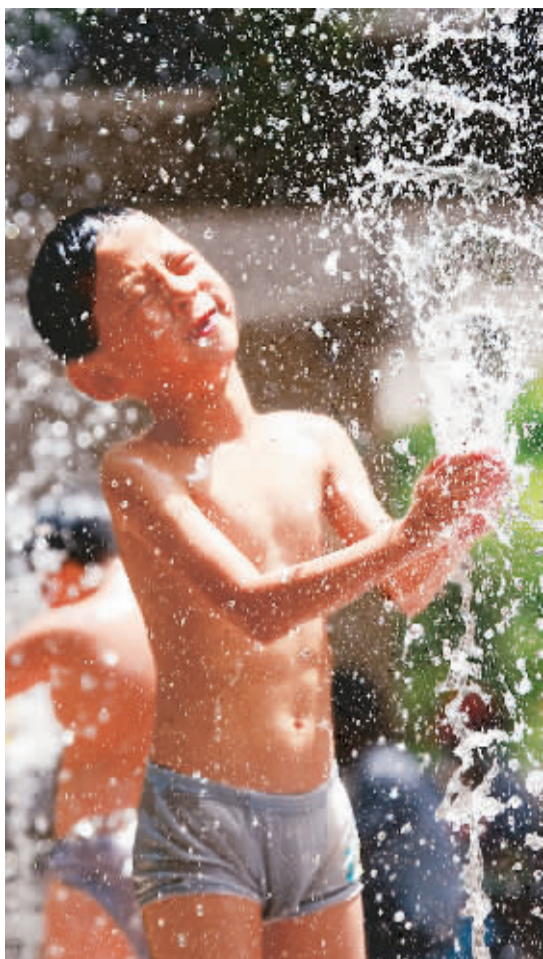
7月28日,一名小朋友在杭州市青少年宫的喷泉水柱间嬉戏消暑。

“看看温度表去三亚海边避暑,这里好凉快!”日前,许多网友在微博上转发评论,还有人在网上晒出“马路边石头上煮熟的鸡蛋”、“在阳台上晒焦的被子”等照片。