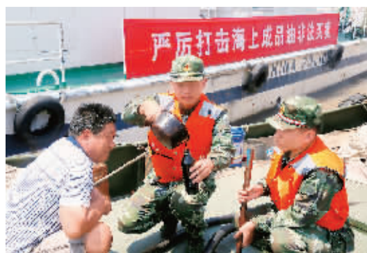
针对近期沿海非法买卖成品油活动猖獗的情况,浙江舟山边防支队在舟山海域开展专项整治行动。图为7月28日,边防民警在一艘油船上进行油品抽样检查。