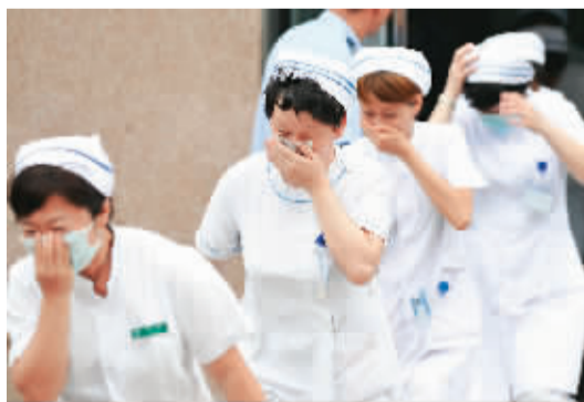
7月29日,天津卫生系统消防应急安全演习在南开医院举行。图为医务人员参加应急疏散演习。