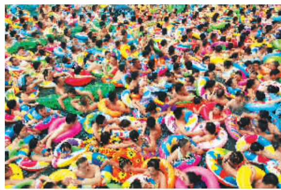
上万名游客在位于四川省大英县的“中国死海”,玩水上漂浮,纳凉避暑。

气象学上一般把日最高气温达到或超过35℃时称为“高温”,如果出现3天以上的连续高温天气,则被称为“高温热浪”。而今年夏天,浙江、湖南、重庆等地高温持续日数达20天以上,称得上是“热浪滚滚”。