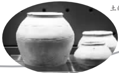
九龙旺角出土的汉代陶罐。