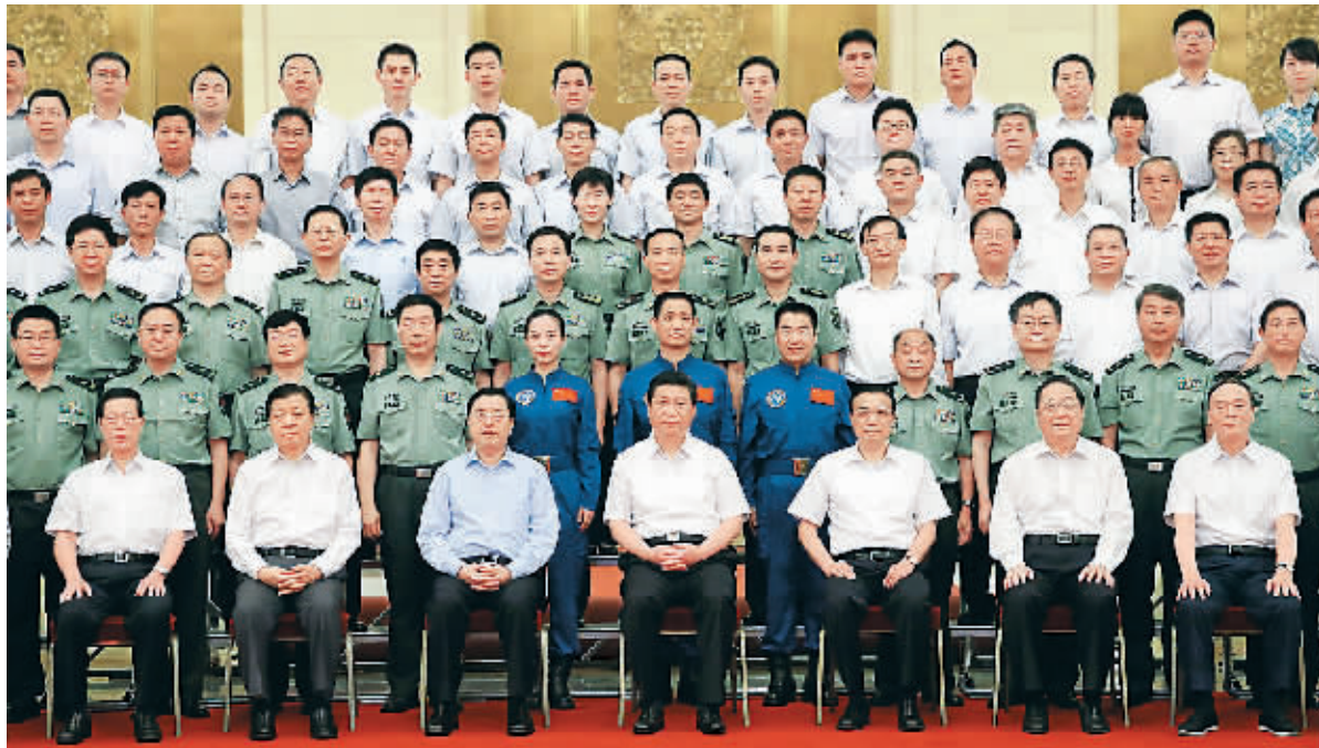
“神十”三杰获颁航天功勋奖章