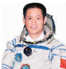
聂海胜 二级航天功勋奖章