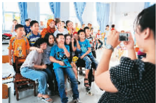
7月22日,12名外籍大学生志愿者在长春市新湖镇榆树村小学给孩子们上了最后一课。图为志愿者与孩子们合影。