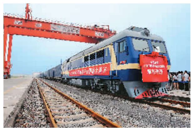
图为首班郑欧国际铁路货运班列准备从郑州铁路集装箱中心站出发启程。新华社记者 李博摄

据新华社郑州7月18日电 (记者秦亚洲) 河南省郑州市18日正式开行直达德国汉堡的国际铁路集装箱货运班列。班列运行路线选定为:郑州至德国汉堡,即从郑州铁路集装箱中心站发车,经阿拉山口途经境外五国(哈萨克斯坦、俄罗斯、白俄罗斯、波兰、德国),用时16—18天。这比货物从郑州经海运抵达欧洲的时间缩短15天左右。