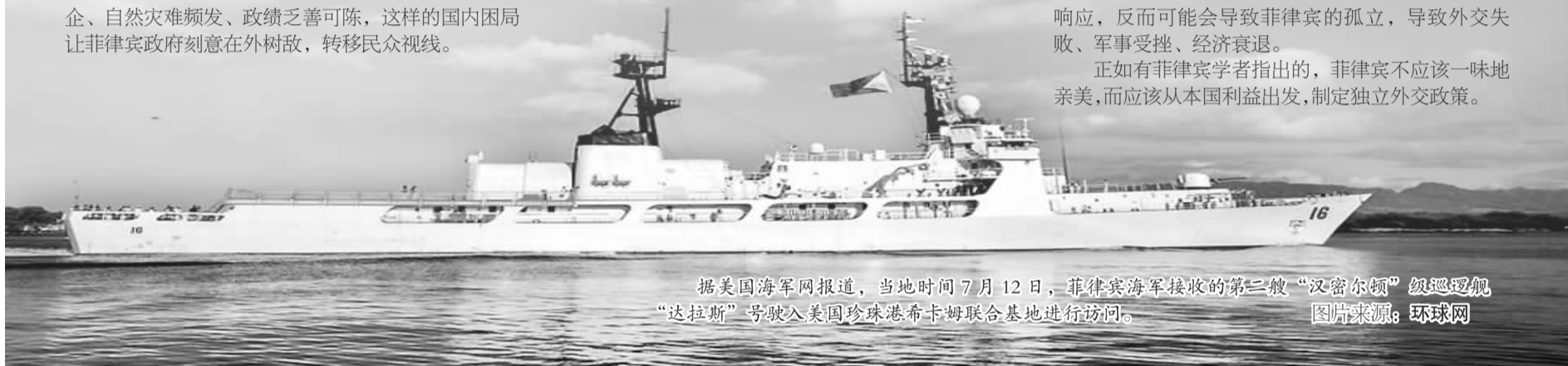
据美国海军网报道，当地时间7月12日，菲律宾海军接收的第二艘“汉密尔顿”级驱逐舰“达拉斯”号驶入美国珍珠港希卡姆联合基地进行访问。

正如有菲律宾学者指出的，菲律宾不应该一味地亲美，而应该从本国利益出发，制定独立外交政策。