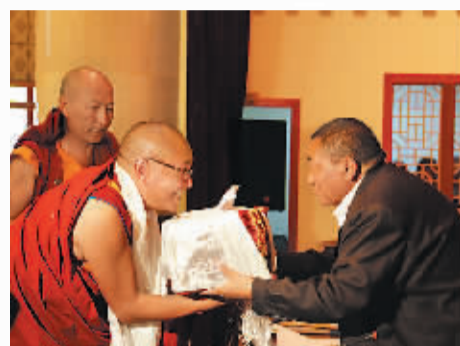
7月15日，珠康·土登克珠（右）给毕业生颁发毕业证。

记者了解到，学院的首批学员是从全区各教派寺庙优秀学经僧人中推荐入学的，在这里，学员们不分教派，显密结合，共同在佛学院研修佛法，做到了教派平等、学员平等、和谐共处。