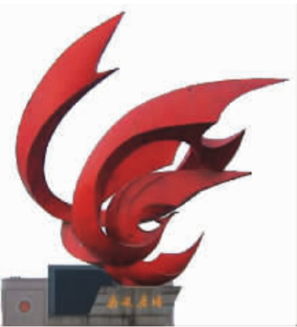
南风广场上的“凤舞”雕塑