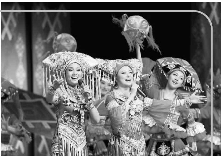
7月10日，“2013泰国·中国广西文化年——美丽广西”展演交流活动在曼谷中国文化中心开幕，活动将以展览、演出等多种形式向泰国观众集中展现广西民族文化的独特魅力。泰国诗琳通公主为开幕式剪彩。