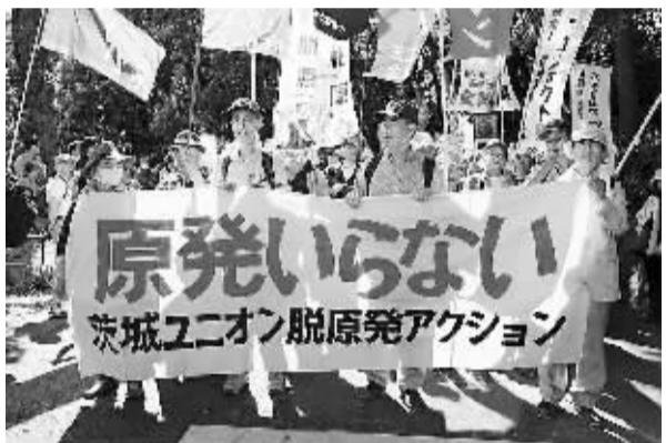
2013年6月2日，日本民众参加反核游行，标语内容为“不要核电站”。

正如吕耀东所指出的，“日本只有吸取二战的教训，从亚太和世界的福祉出发，和平利用核能，才是明智之举。”