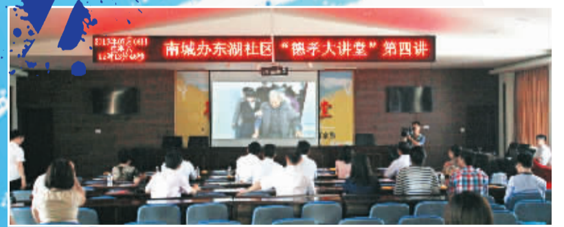
德孝大讲堂是德孝文化建设的一部分