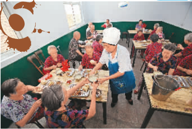
这里的一日三餐方便卫生、营养丰富