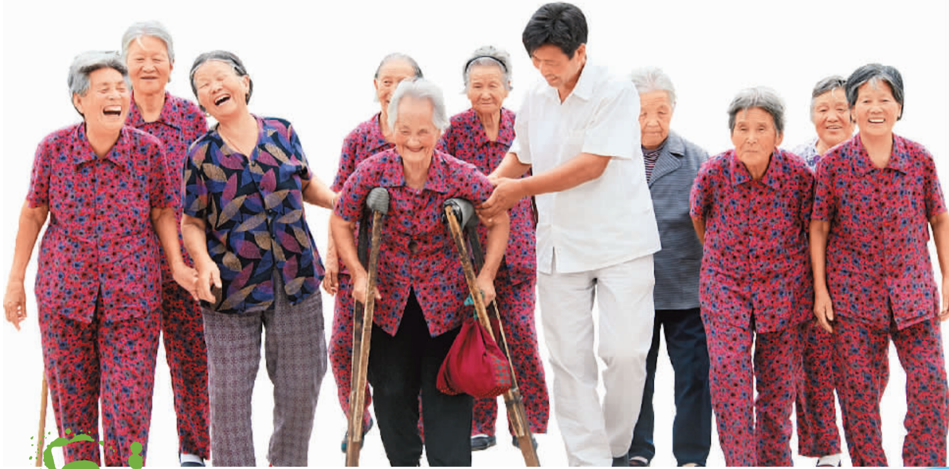
工作人员和老人们在一起，让这里更像一个其乐融融的“家”