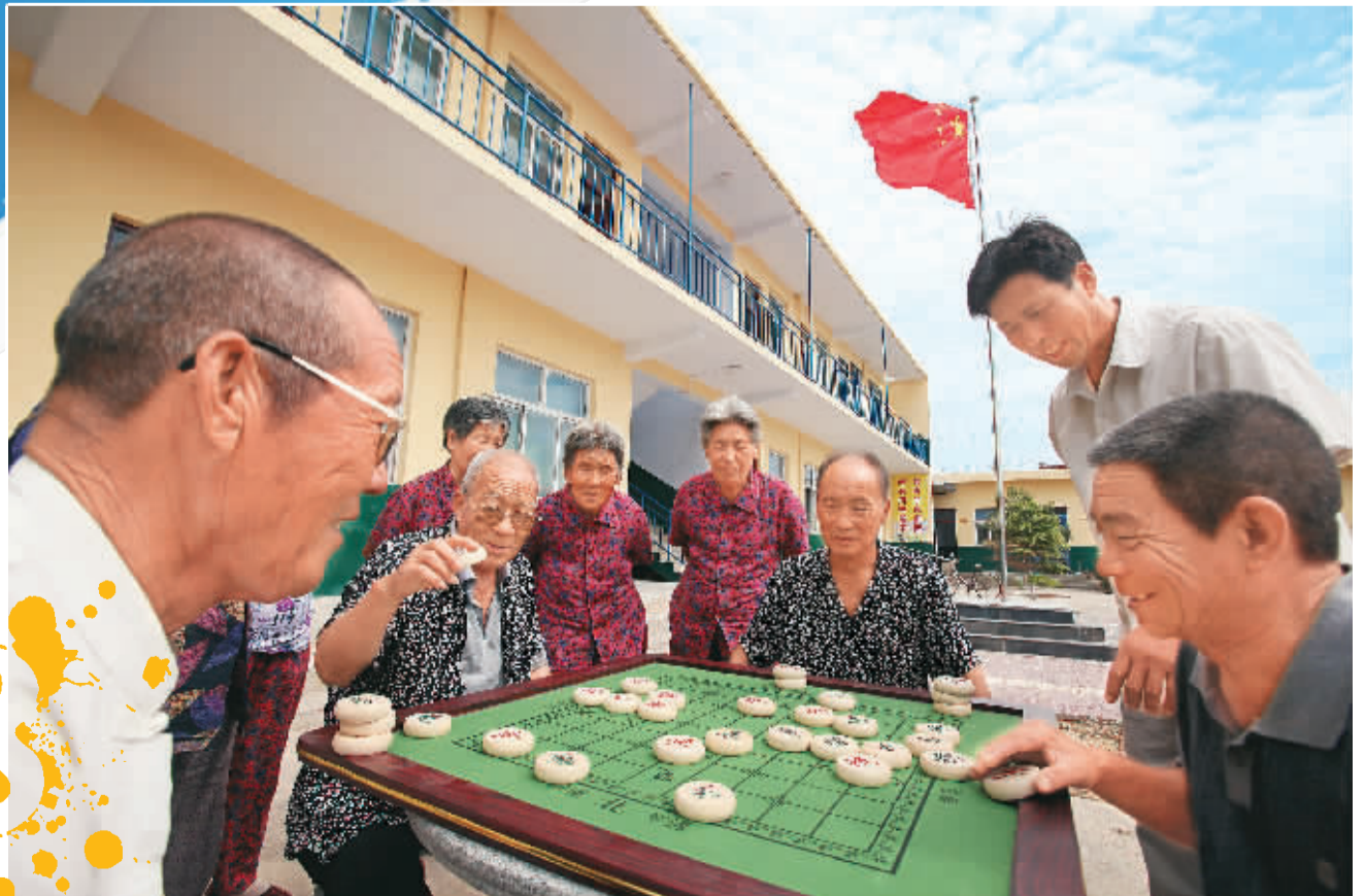
老人们聚集在日间照料中心，一起打牌、下棋，精神上也更愉悦