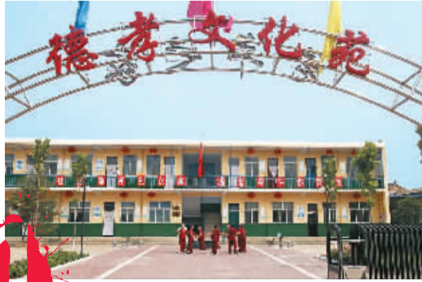
日间照料中心是塑造德孝文化的特色之举