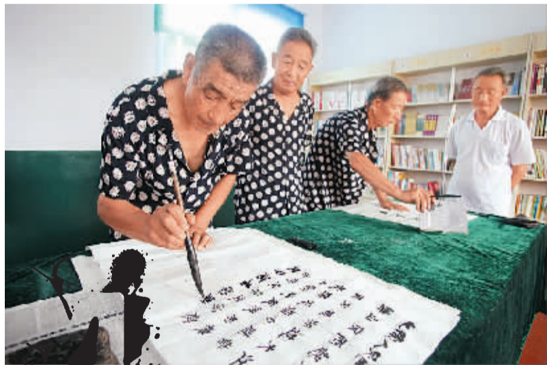
老人在日间照料中心练书法