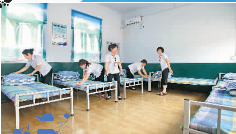
护理人员在为老人整理床铺