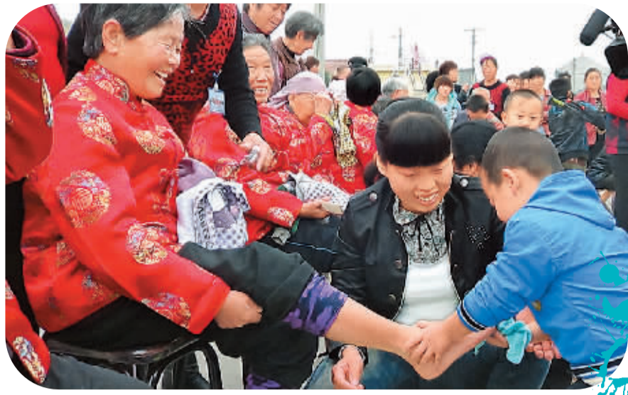
孩子也来为姥姥尽孝心