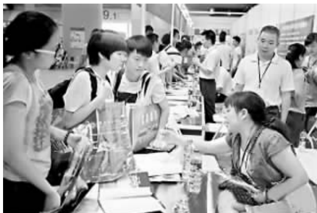
许多高校推出中外合作办学项目。

笔者获悉，我国现有的中外合作办学大致分为三种类型，一是独立大学，类似西交利物浦大学、宁波诺丁汉大学、上海纽约大学等；二是学校之下的非独立法人，类似上海交大密西根学院；三是中外合作项目，即中方教育机构和国外教育机构只在某一项目上联合办学。