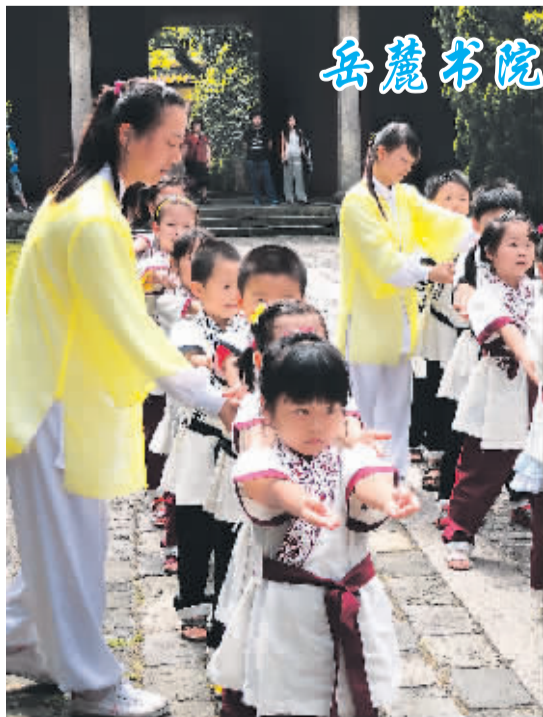
岳麓书院教授亲子课

11.4万人，农作物受灾面积152千公顷，倒塌房屋2100余间，近5000间房屋不同程度损坏，直接经济损失近7亿元。省委副书记张昌尔率有关部门组成的工作组在汉川市指导救灾工作，湖北省减灾委、民政厅紧急启动三级救灾应急响应，调运发放3000床棉被和毛巾被、1800件T恤衫、50张折叠床，帮助灾区妥善做好受灾群众基本生活救助工作。