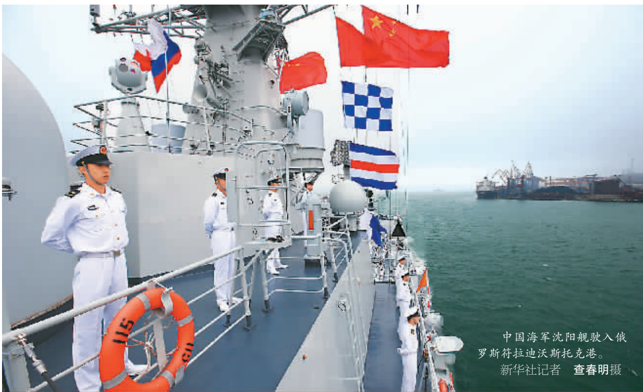
中国海军沈阳舰驶入俄罗斯符拉迪沃斯托克港。

中俄双方参演兵力共计各型水面舰艇18艘、潜艇1艘、固定翼飞机3架、舰载直升机5架和特战分队2个。其中中方参演各型水面舰艇包括沈阳舰、石家庄舰、烟台舰、盐城舰、武汉舰、兰州舰、洪泽湖舰,飞机为直九C型舰载反潜直升机。俄方参演各型舰艇包括“瓦良格”号巡洋舰、“维诺格拉多夫海军上将”号大型反潜舰、“快速”号驱逐舰、格里莎级小型反潜舰等舰艇,各型飞机包括伊尔—38反潜侦察机、苏—24M重型战斗轰炸机、卡—27舰载直升机等。