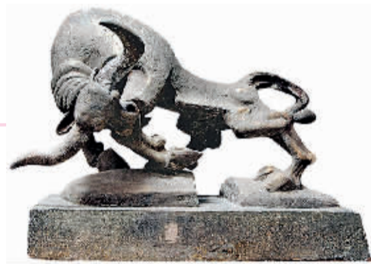
精灵系列——牛(铜) 曾成钢