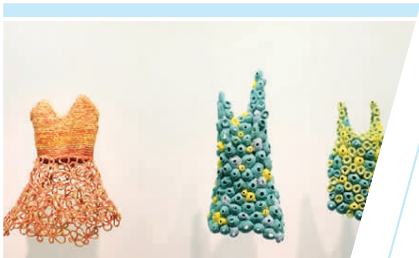
染织与服装专业学生作品