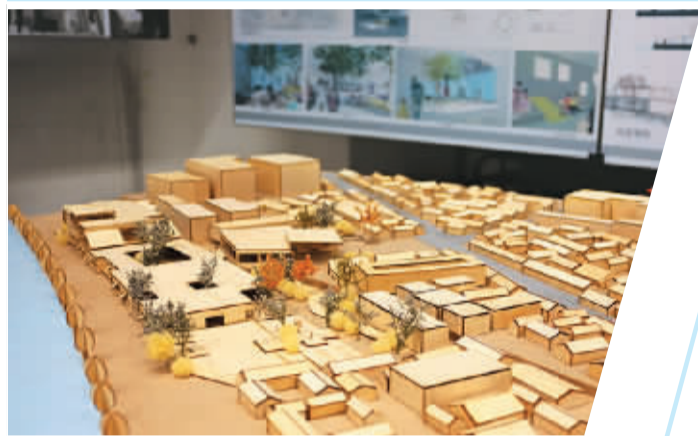
环境艺术与景观设计专业学生作品