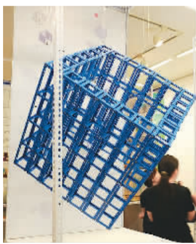
展示设计专业学生作品

即使有学校的大力推广，许多艺术专业学生仍然认为目前的展示交流平台不足，尤其缺少针对毕业生创作的高层次展示平台。湖北美术学院院长徐勇民说：“每年各高校的毕业展季，如果有一个传媒平台，能更便捷地展示各专业院校的毕业创作，将会有利于各高校教学成果的交流，也是对目前优秀作品巡展方式的有效补充。”