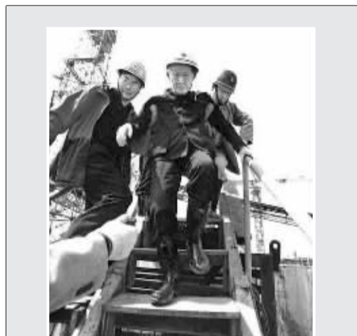
三峡工程开工后，年近九旬的张光斗(中)每次检查三峡工程质量，都要艰难地下到施工仓面，亲自观察混凝土浇筑情况。

夕，张光斗在台湾的同学和友人纷纷来电，催他去台工作。他一一婉拒，还将当时准备运往台湾的一批技术档案和资料暗中保存下来，这些资料很快被用于新中国的建设。新中国成立后，张光斗全身心投入祖国的水利水电事业，在祖国版图上每一个有河流的地方，几乎都曾留下他的身影。