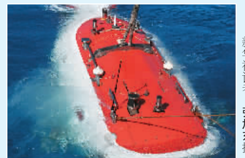
图为入水的“蛟龙”号载人潜水器。

据新华社“向阳红09”船6月28日电 (记者张旭东) 正在南海执行首个试验性应用航次的“蛟龙”号载人潜水器28日在南海“蛟龙海山”区下潜, 这次下潜主要进行了长基线定位系统测试。