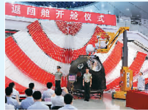
图为工作人员在打开返回舱的舱门。

本报北京6月28日电 (记者余建斌) 今日下午, 神舟十号返回舱开舱仪式在中国空间技术研究院举行, 这里也正是神舟飞船的“出生地”。随着一声“开舱”指令下达, 工作人员使用开舱“钥匙”打开返回舱, 陆续取出搭载的物品。随后, 在开舱现场进行了搭载物品的移交。 此次移交的搭载物, 既有在神十任务中搭乘神舟十号飞船飞行15天的物品, 也有跟随天宫一号飞行630多天、由神十航天员带回的物品。仪式上还展示了由航天员带回地面的天宫一号内饰物“中国结”。