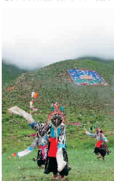
图为唐卡展开现场。

本报拉萨6月28日电 (记者扎西) 28日上午11时许, 西藏自治区墨竹工卡县尼玛江热乡其玛卡村, 山坡上一幅巨型唐卡徐徐展开, 铺满大半个山坡。随之, 世界纪录协会高级认证师宣读: “山坡上正展开的唐卡成功打破了世界纪录, 成为目前世界面积最大的唐卡。”