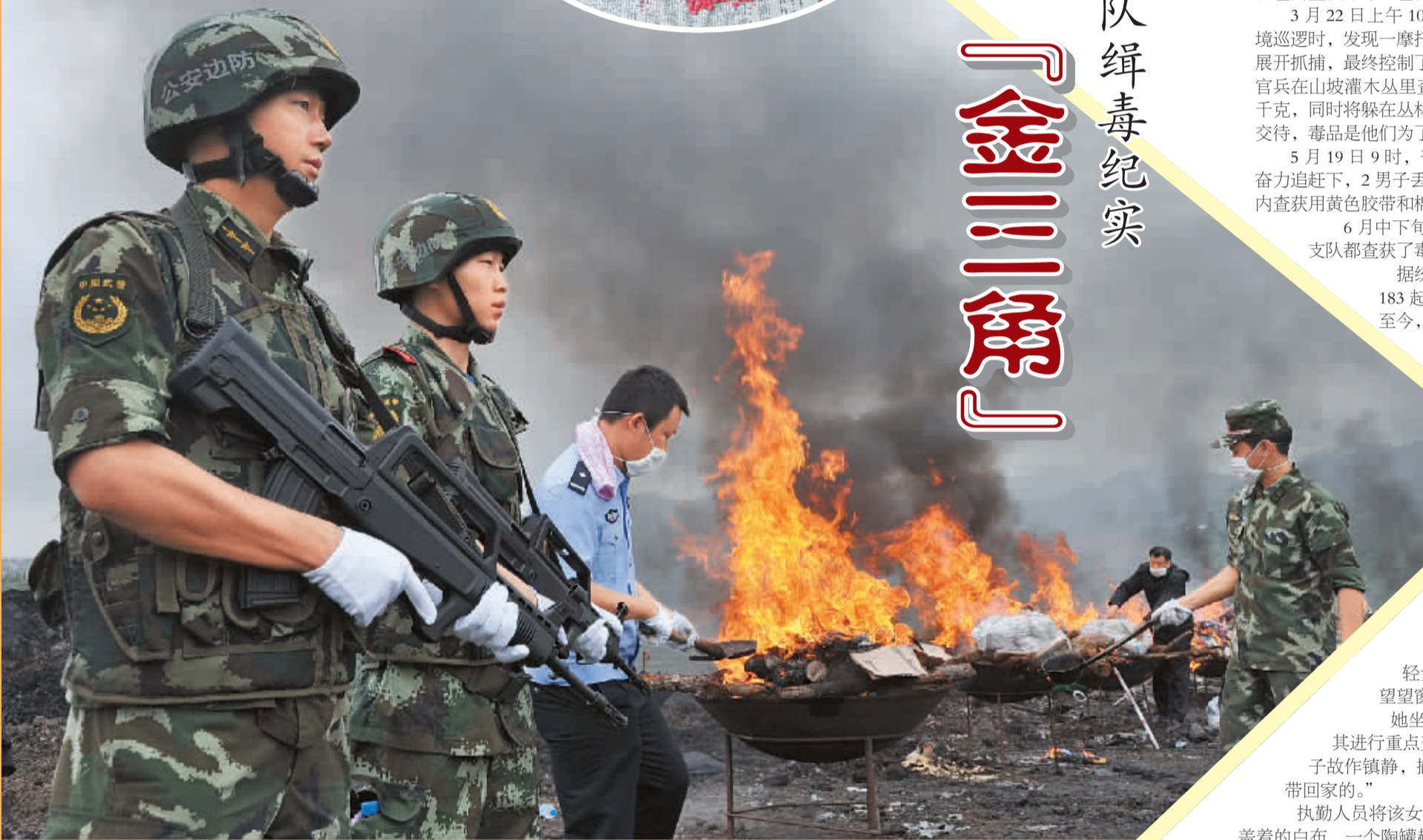
临沧边防支队官兵在公开销毁毒品。