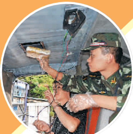
普洱边防支队官兵查获货车藏毒。