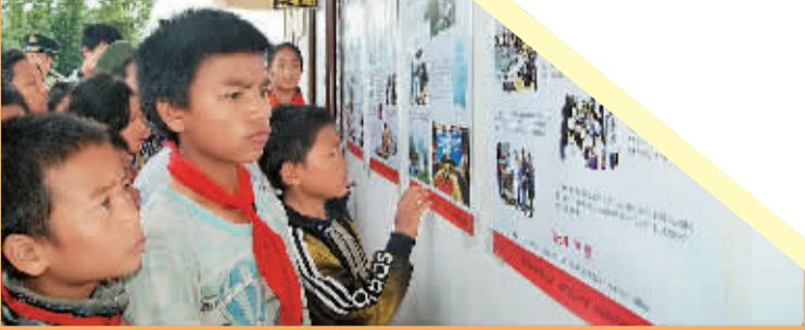
6月23日，云南沧源边防大队勐董边防派出所永和社区进行禁毒宣传，图为永和社区居民在观看禁毒宣传栏。

由于毗邻世界上最大毒源地“金三角”，长久以来，云南部分边境地区蒙上了毒品的阴影。“6·26”国际禁毒日前夕，记者来到云南公安边防部队采访，该部队官兵常年战斗在八千里边境一线，他们与毒贩斗智斗勇，在金三角与内地之间筑起了一道坚实的屏障。今年以来，该总队已破获毒品案件1234起，抓获毒品犯罪嫌疑人1880名，缴获毒品2286千克，缴获易制毒化学品近226吨。