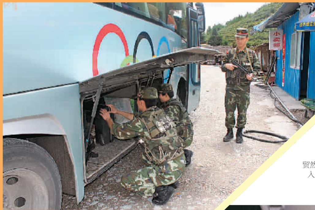
保山边防支队芒颜边境检查站官兵在检查货车行李箱。