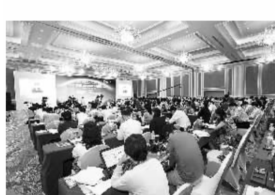
嘉宾在论坛上聆听专家演讲。

思想碰撞出成长生肌。资料显示，过去20年，亚洲发展中国家经济年均增长8%，金融危机以来对全球经济增长贡献率达到50%。目前亚洲经济总量已占世界30%以上。世界经济重心正从西方移向亚洲，国际社会将更多目标投向了太平洋西岸。