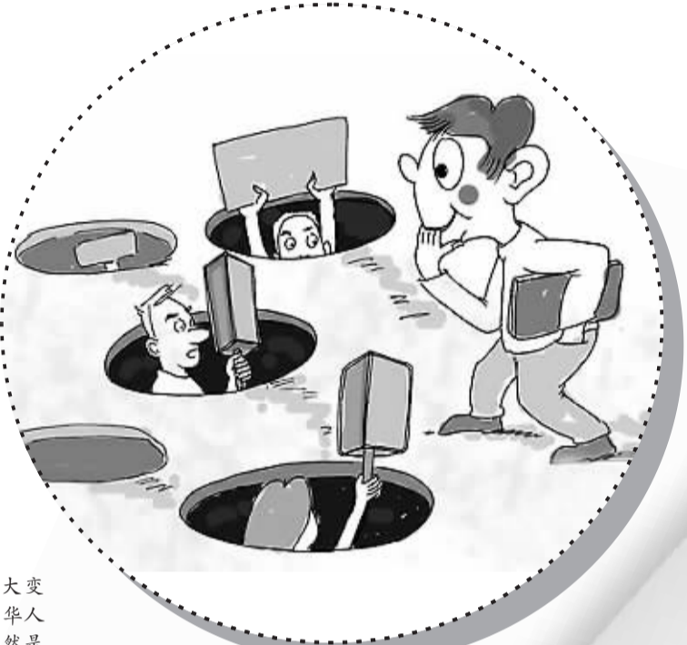
漫画：招聘陷阱 杰清作

近日，意大利科莫省一对华人夫妇因将5岁的女儿独自留在家中而被控抛弃和虐待未成年人，并开始接受庭审调查。据意大利宪兵队调查人员称，这对夫妇的邻居听到了孩子的哭声报了警。