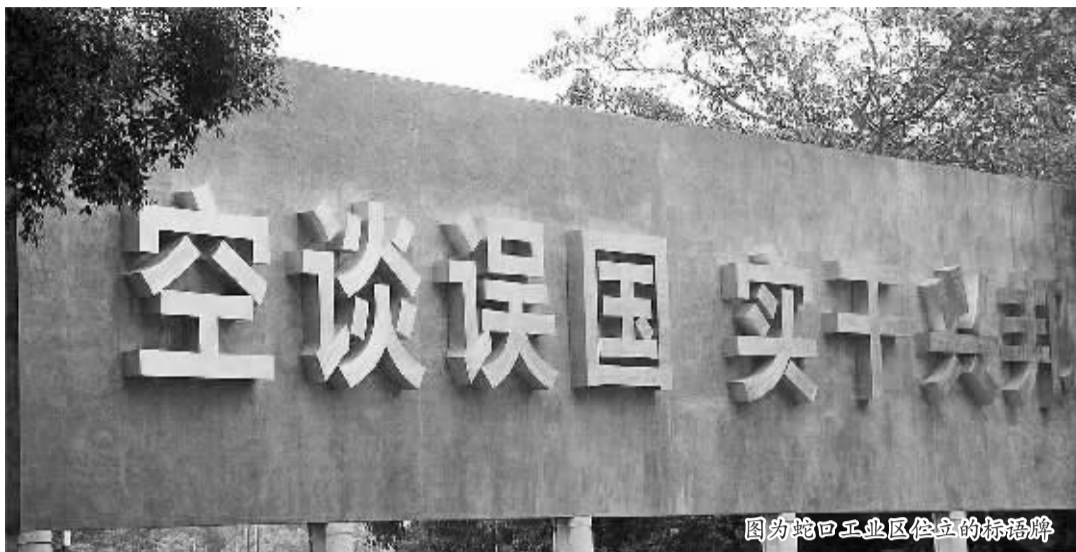
图为蛇口工业区竖立的标语牌

2012年11月29日,习近平总书记在国家博物馆参观《复兴之路》展览时,深情阐述中国梦,其中特别提到“空谈误国,实干兴邦”这一激励人心的口号。12月7日至11日,习总书记首次离京视察广东深圳、珠海等地,再一次强调“空谈误国,实干兴邦”。