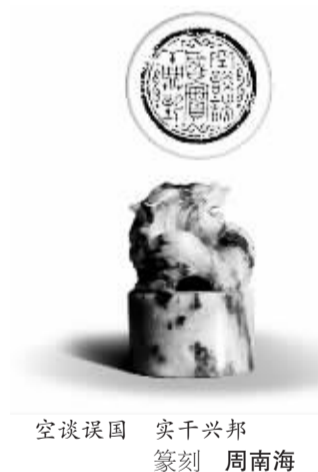
空谈误国 实干兴邦 篆刻 周南海