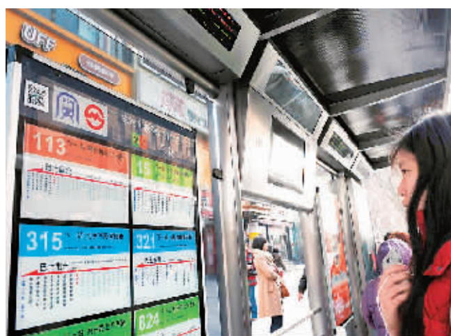
上海市民用手机扫描公交站牌上的二维码，即可显示本站所有公交线路、首末车时间、到本站还有几站距离等信息。（资料图片）