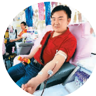
▲青海西宁市民在街头献血车内献血。 ▲浙江临安市民在展示无偿献血证。 ▼山东青岛市民在填写无偿献血登记表。