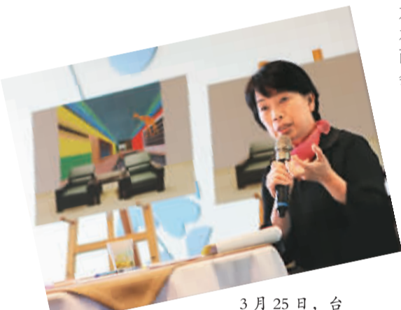
3月25日，台湾文化部门负责人龙应台宣布艺术银行成立。

过一段时间，台湾的松山机场、桃园机场、高速公路休息站、台北火车站、港务公司营运大