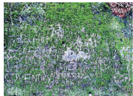
太平山狮子亭路边斜坡上的涂鸦

根据香港法律，在任何公众地方，以雕刻或其他方式在石头上涂鸦，即属违法，一经定罪，可处罚款500元或监禁3个月。