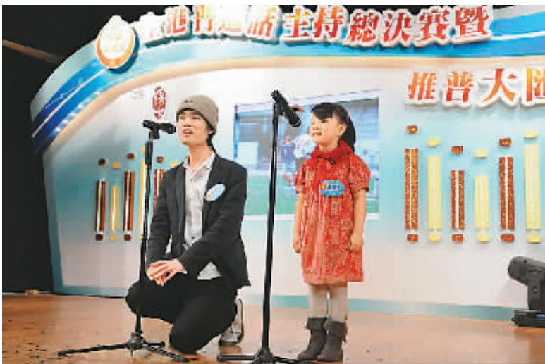
香港广播主持人选拔赛（公开组及中学组）推广普通话大汇演现场。

但有一个事实也不可忽略，以香港教育学院为例，目前仅有一半半修中文的学生普通话水平达二乙或以上，水平有待提高。“就普及而言，普通话在港人心中已不再陌生”，詹伯慧同时表示，还应“提高教学要求，深入研究层面”。