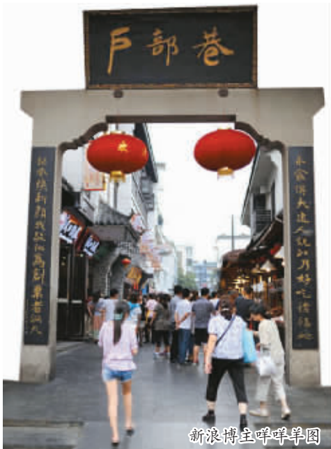
这几年，武汉户部巷都快跟黄鹤楼齐名了，来武汉的游客无论如何也要到此一游的。终于等到了周末，我决定和几个同学去户部巷见识一番。

刚走近巷口，我们就闻到了美食街飘来的香味。“哎，海南椰子，新鲜的海南椰子！”“来一只。”“我要两只！”巷口卖椰子的伙计叫得可带劲了。堆积成小山的椰子摊位前排起了长长的队伍，几个工作人员忙得都来不及收钱。食客们接过插着吸管的椰子低头就吸，有一家子把3根吸管一起插进去，3个脑袋一齐吸，还连声说：“不错，好喝。”