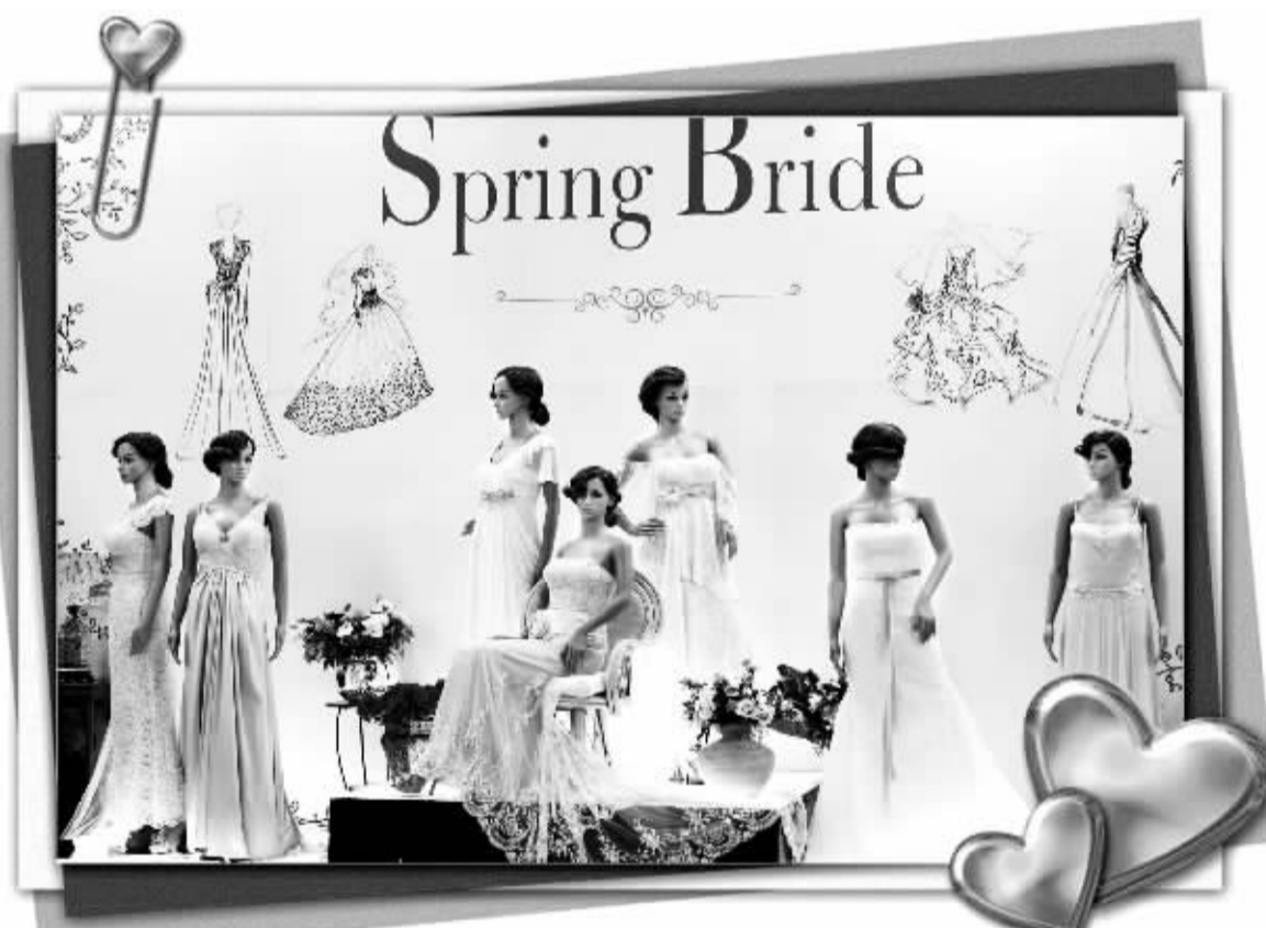
全亚洲最大规模的婚博会“第71届夏日婚纱婚嫁服务博览及婚嫁美容展2013”，6月7日起一连三日在香港会展中心举行。场内提供婚纱礼服、本地及海外婚纱摄影、酒店及酒楼婚宴等产品及服务，助新人轻轻松松打造梦想中的盛大婚礼。