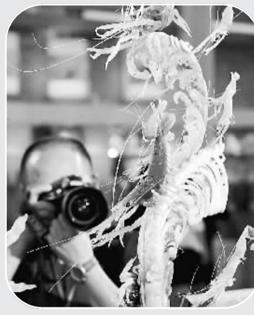
博览会上的旅游商品