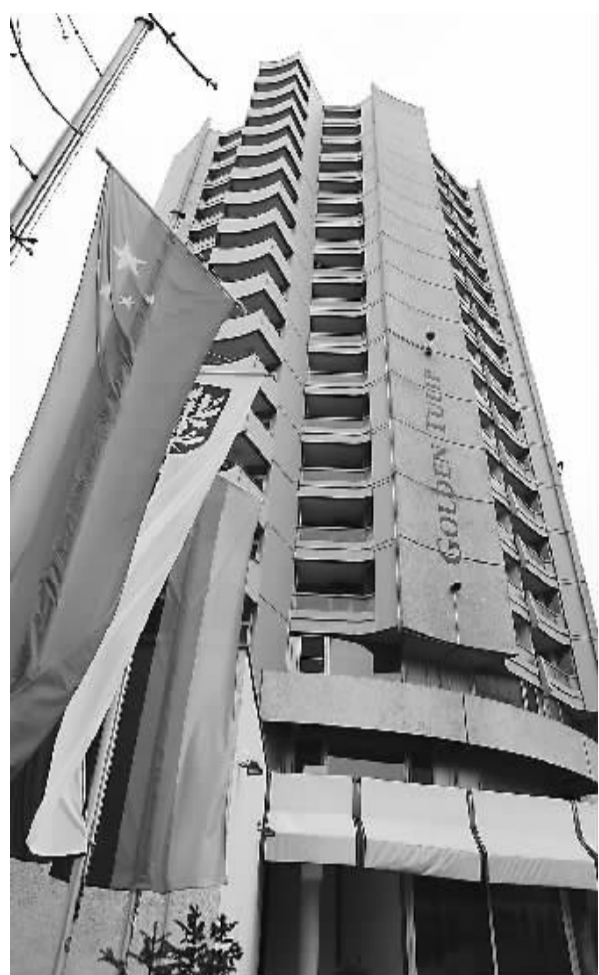
五星红旗飘扬在德国金都金香饭店门口

日前，位于德国法兰克福与奥芬巴赫两市交界处美因河畔的金都金香饭店，大门前悬挂起了一面五星红旗，标志着这家当地著名酒店的产权已经易主。收购它的是一家来自中国的民营企业，也是目前中国规模最大的酒店集团之一——开元旅业集团。