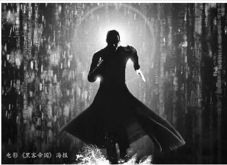
电影《黑客帝国》海报

早在上世纪90年代，美国就提出了网络战的概念，网络空间也被称为陆地、海洋、天空、太空之外的“第五空间”。如今，美军拥有全球最大规模的网络攻击军团，他们的战绩也早已让世界瞩目：2010年，大名鼎鼎的“震网”病毒攻击了伊朗核电站，至少有3万台电脑“中招”，1/5的离心机瘫痪；2012年，威力巨大的