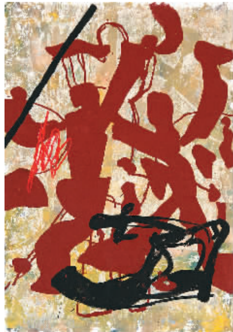
中国系列 002 周氏兄弟

曾经从“故乡”出发到“异国他乡”寻梦，如今，周氏兄弟又从已然征服的“他乡”逆向出发回到生养熟悉的土地“故乡”，似乎一个生命的轮回。他们表示：正在焕发出人生中又一个冲浪的高峰以及一切未知的可能性。